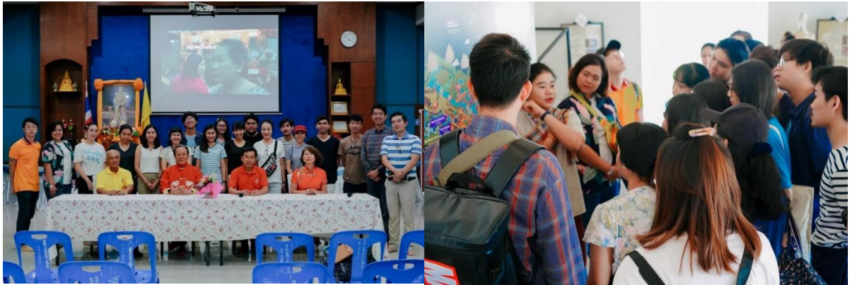
ภาพโครงการปฏิบัติการทักษะการเก็บข้อมูลวิจัย

วิทยากรจากต่างประเทศ เพื่อให้ผู้เรียนเกิดการเรียนรู้ที่หลากหลาย และสามารถตกผลึกตามปรัชญาของหลักสูตรที่สามารถใช้งานวิจัยเพื่อพัฒนาคุณค่าแก่สังคม อีกทั้งมุ่งเน้นให้เกิดการปฏิบัติจริงโดยให้นิสิตได้ลงพื้นที่ในการเก็บข้อมูลวิจัย การลงพื้นที่เก็บข้อมูลเชิงลึก โดยจัดโครงการปฏิบัติการทักษะการเก็บข้อมูลวิจัยโดยจัดกิจกรรมเต็ม 3 วัน ณ จังหวัดชลบุรี