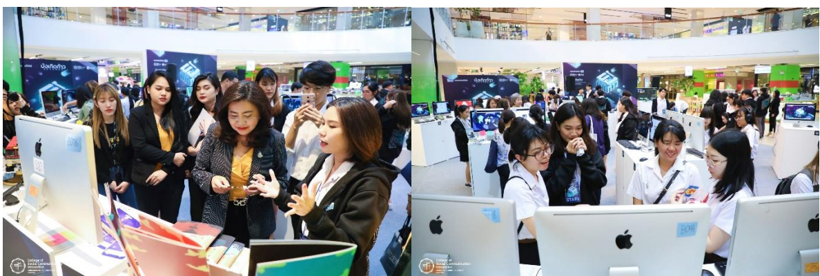
ภาพนิทรรศการนวัตกรรมสื่อสารนิพนธ์ที่ ศูนย์การค้า Central world

หลักสูตรยังมีการให้นิสิตเข้าร่วมนำเสนอผลงานในรูปแบบงานสร้างสรรค์ และเข้าร่วมการประชุม และร่วมดำเนินการจัดงานประชุมวิชาการนานาชาติ Social Science Art and Media International Conference ซึ่งวิทยาลัยนวัตกรรมสื่อสารสังคมเป็นเจ้าภาพร่วมกับสถาบันการศึกษาในต่างประเทศรวม 8 ประเทศ นอกจากนี้ยังมีการนำผู้เรียนศึกษาเรียนรู้นอกสถานที่ และเข้าอบรมตามความร่วมมือกับ รวมถึงการเชื่อมโยงการศึกษากับนิสิตระดับปริญญาตรี โดยจัดสถานการณ์ให้เรียนเป็นผู้วิพากษ์ผลงานของนิสิตในระดับปริญญาตรี ในโครงการแสดงนวัตกรรมสื่อสารนิพนธ์ ในสาขาการออกแบบสื่อปฏิสัมพันธ์และมัลติมีเดีย เพื่อส่งเสริมให้ผู้เรียนสามารถคิดวิเคราะห์ และนำเสนอข้อคิดเห็นในการพัฒนา และต่อยอดผลงานสู่การพัฒนาสังคม