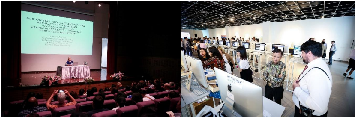
ภาพงานประชุมวิชาการนานาชาติ Social Science Art and Media International Conference

หลักสูตรได้จัดอบรมนิสิตตามความร่วมมือกับ Domus Academy ณ นครมิลาน ประเทศอิตาลี ในหลักสูตร MA in Business Design รวมถึงได้เรียนรู้ประสบการณ์ด้านการออกแบบ และธุรกิจการออกแบบในประเทศอิตาลี