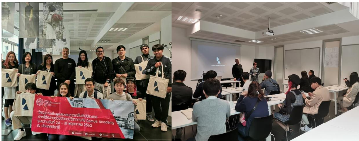
ภาพโครงการอบรมนิสิตตามความร่วมมือกับ Domus Academy ณ นครมิลาน ประเทศอิตาลี

หลักสูตรได้จัดอบรมนิสิตตามความร่วมมือกับ Domus Academy ณ นครมิลาน ประเทศอิตาลี ในหลักสูตร MA in Business Design รวมถึงได้เรียนรู้ประสบการณ์ด้านการออกแบบ และธุรกิจการออกแบบในประเทศอิตาลี